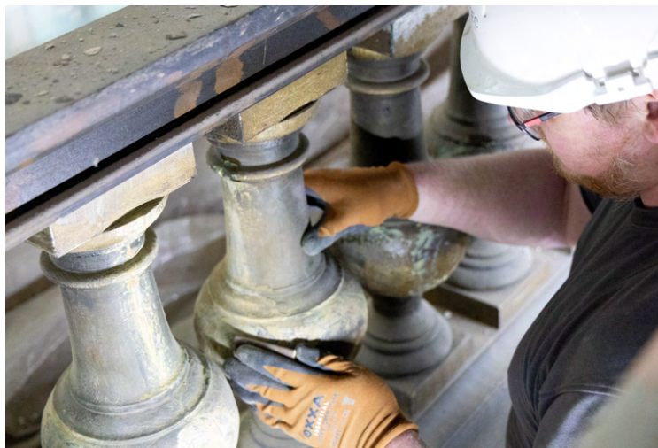
De restauratiewerken gingen van start in augustus 2025.